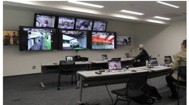
災害時を想定した訓練の様子(2022年7月)