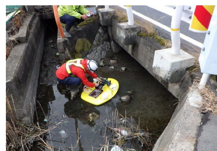
ボート型ドローンでの撮影