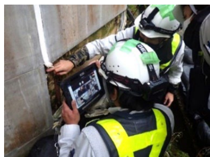
現場での細部中継撮影