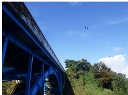
現場でのドローン撮影