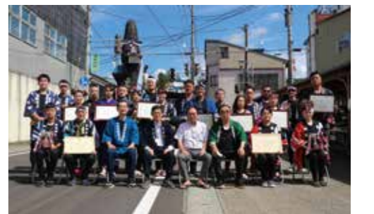
9日に角館祭りのやま行事実行委員会本部前で実施した表彰式の様子。

9月8日、佐竹北家上覽時に、各丁内の曳山が一堂に会し、おやま囃子コンクールが開催されました。 厳正な審査の結果、次の方々各賞を受賞されました。（敬称略）